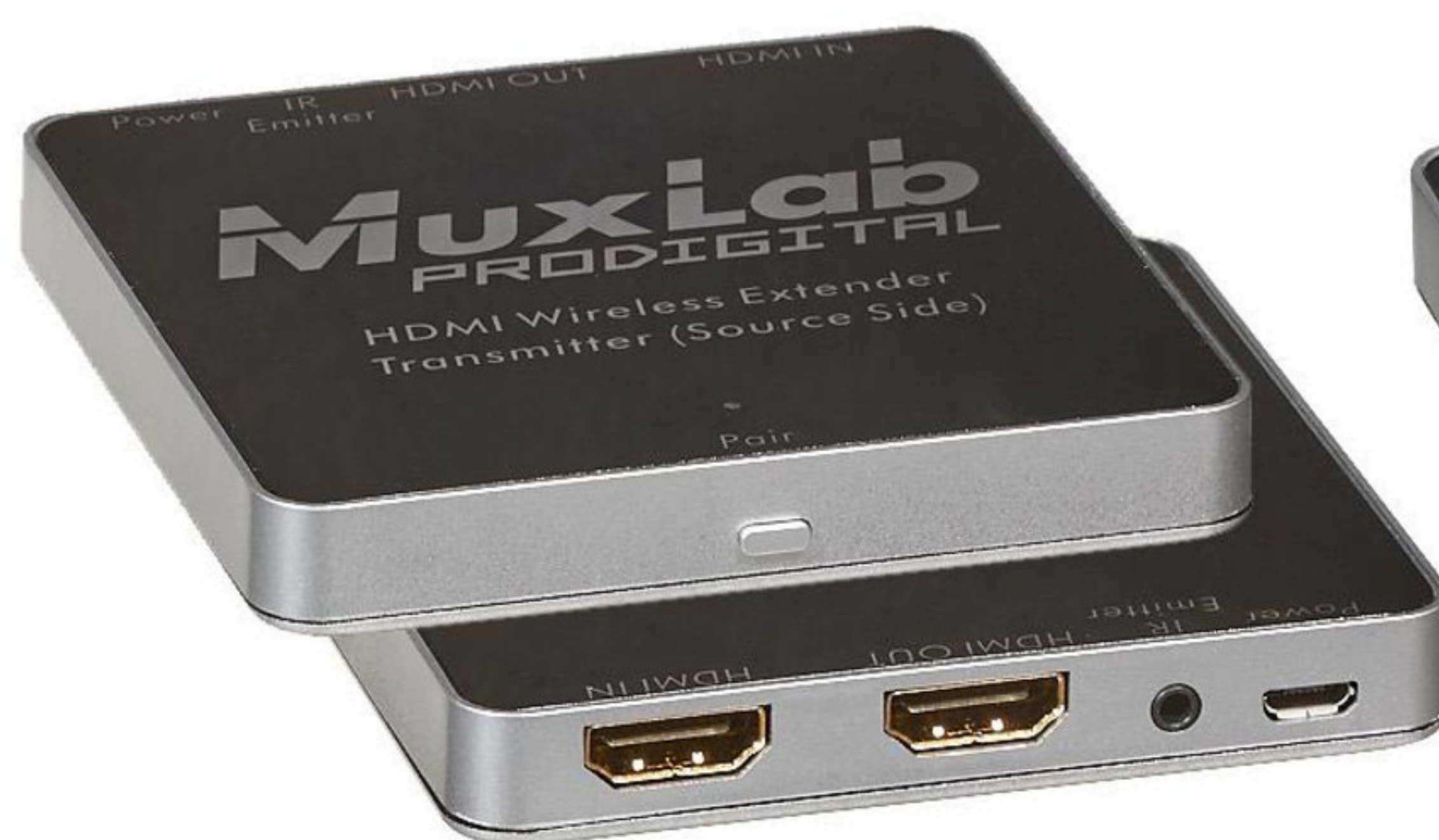
Передатчик (подключение к источнику)