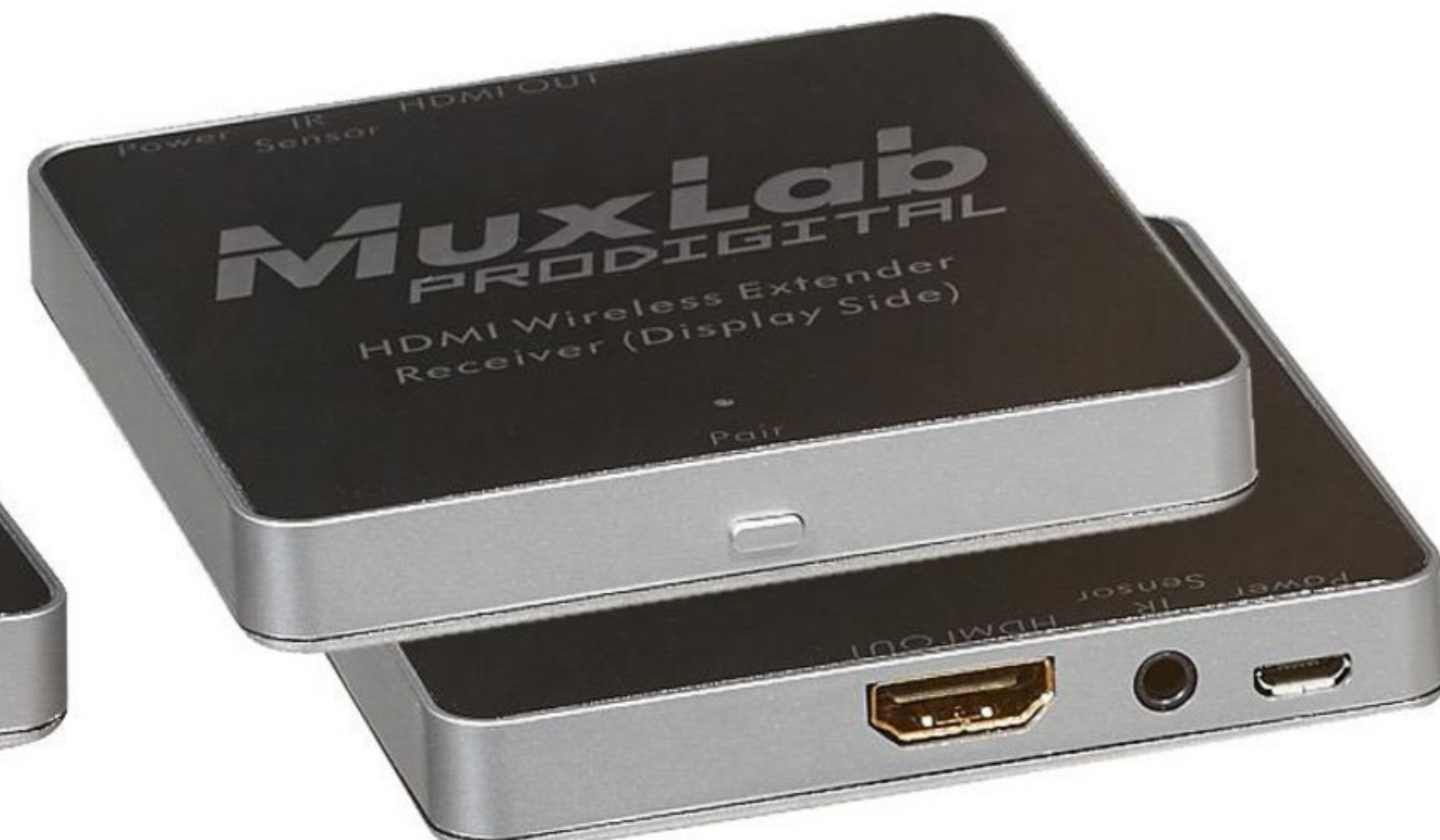
Приемник (подключение к дисплею)